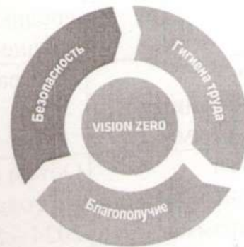
Рис. 1. Семь «золотых правил» производства с нулевым травматизмом и безопасными условиями труда (концепция «Нулевого травматизма» (Vision Zero))

« Vision Zero » или « Нулевой травматизм » – качественно новый подход к организации профилактики, объединяющий три направления – безопасность, гигиену труда и благополучие работников на всех уровнях производства